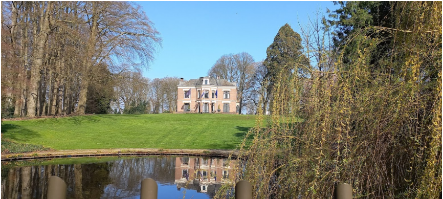
Villa de Haer, Oldenzaal

De stad staat bekend als Hanzestad of Boeskoolstad. Oldenzaal wordt tijdens de carnavalsperiode Boeskool genoemd. In de regio staat Oldenzaal naast de carnaval, bekend om haar gezelligheid en andere evenementen. Net buiten Oldenzaal zien we een prachtig huis, het heet villa de Haer.